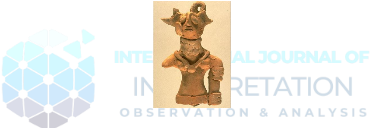
Figure No .2 Early female figurine with painted features from Harappa, Image Source Retrieved on 24 March 2020 from www.harappa.com ,size (W x H x D): 3.7 x 7.9 x 2.4 cm.