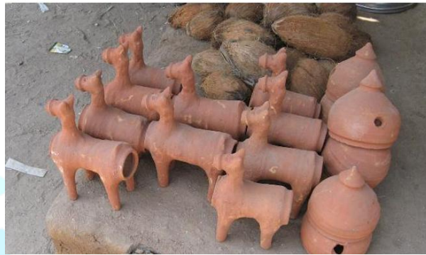
Figure No .5 Terracotta horses