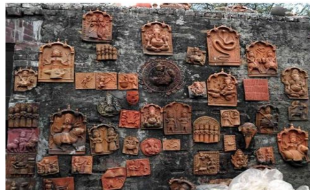
Figure No .7 Terracotta artwork Rajasthan