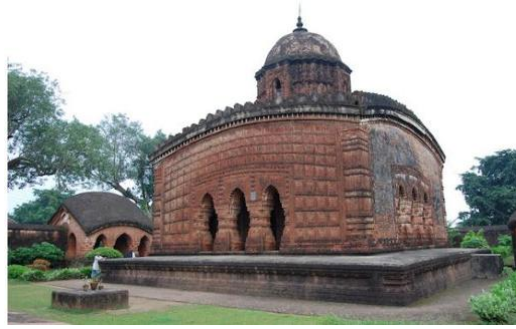
Figure No .4 Madan-Mohan Temple, Bishnupur, Bankura, Image Source Retrieved on 24 March 2020 from amitguha.blog .